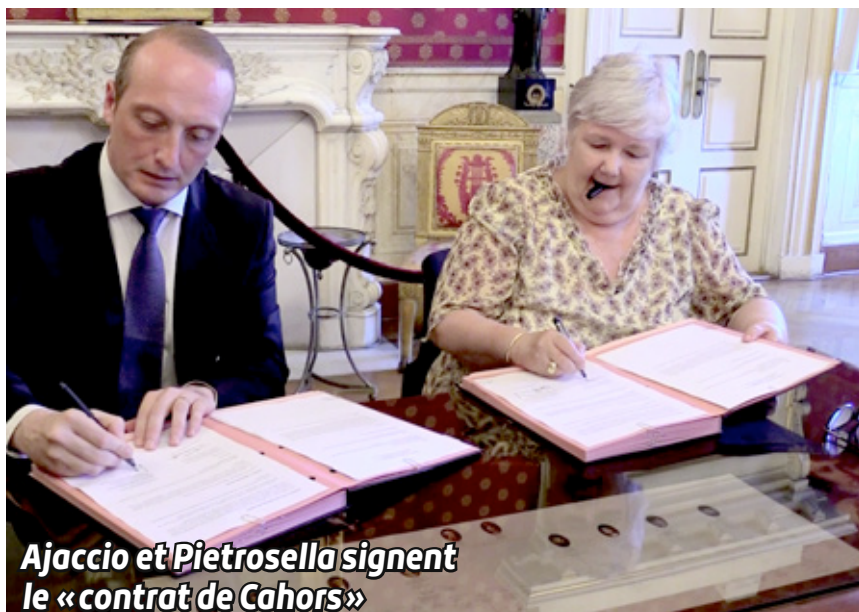
Ajaccio et Pietrosella signent le «contrat de Cahors»

N ouvelle visite sur l'île, le 10 juillet, pour la ministre Jacqueline Gourault qui a signé le contrat dit «de Cahors» avec les maires d'Ajaccio et de Pietrosella. Proposé lors de la conférence nationale des territoires en décembre dernier, ce dispositif de contractualisation avec les principales collectivités locales prévoit que leur participation au redressement des comptes publics ne se traduira plus par une baisse de la Dotation globale de fonctionnement (DGF) mais par un «engagement d'économies». Ce contrat de partenariat 2018-2020 vise ainsi à encadrer leurs dépenses réelles de fonctionnement. « La situation financière de l'Etat doit être contrôlée pour ne pas dépasser nos engagements européens. Il ne faut pas que la dépense publique soit à plus de 3% de PIB. C'est une prise de conscience citoyenne que de signer ces contrats », souligne la ministre.