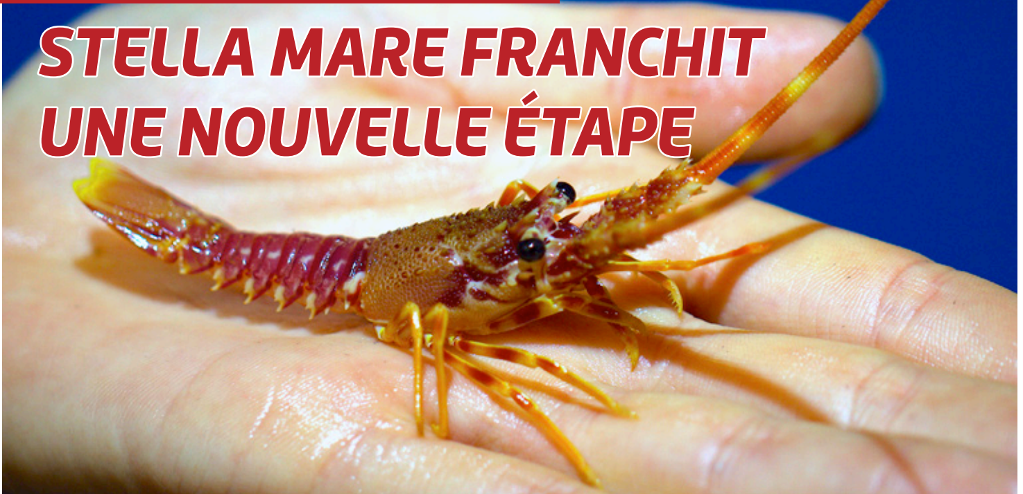
Photo Labo StellaMare © Università di Corsica Service communication

Déjà en pointe en matière de recherches sur la maîtrise de la reproduction de la langouste rouge, la plateforme Stella Mare a fait une nouvelle avancée en parvenant à obtenir des individus juvéniles âgés de plus de 11 mois. Un pas de plus vers la restauration des populations.