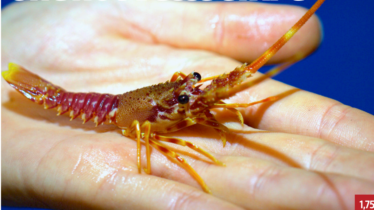
Photo Labo StellaMare © Università di Corsica Service communication