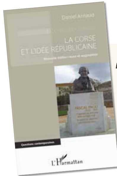
La Corse et l'idée républicaine - L'Harmattan

Un essai sur la mise en place et les déviances du Contrat Social de Rousseau. Une réflexion sur les amalgames, les particularismes, les discours réducteurs et caricaturaux tenus sur la Corse.