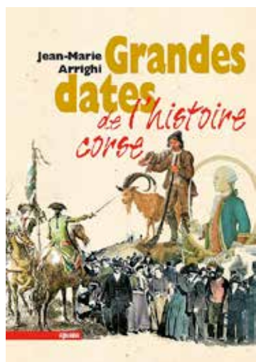
Jean-Marie Arrighi Grandes dates de l'histoire corse, Albiana, 2017

N ous ne parlerons pas cette fois d'un roman de la rentrée mais d'un petit ouvrage sans doute très utile, quoi qu'on puisse en penser, consacré aux Grandes dates de l'histoire corse , et diffusé largement dès le début de l'été à l'attention des insulaires autant que de leurs très nombreux visiteurs : pédagogique et très clairement présenté, il déroule une chronologie historique mentionnant les dates jugées les plus significatives, selon une volonté de vulgarisation scientifique saisie dans son contexte méditerranéen et parfois bien plus largement ; puisque l'on sait que les mouvements sociaux, économiques et culturels, l'histoire des idées et hommes, celle des connaissances générales et particulières, peuvent tisser des liens subtils entre peuples et terres bien au-delà de notre île, depuis les origines.