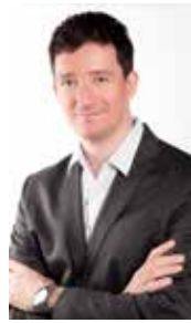
Da Roland FRIAS

Par contre, l'envie de partager avec vous un petit moment de candeur, de fraîcheur. L'innocence d'une enfant de 7 ans qui, le 29 octobre dernier, a échappé à la vigilance de ses parents dans une rue de Genève pour monter dans un train en direction de l'aéroport international. Une gamine qui ensuite a su défier tous les systèmes de sécurité pour s'asseoir dans un avion pour la Corse, direction Ajaccio. Que s'est-il passé dans la tête de cette petite fille? Allez savoir! Pourtant malgré la peur, l'angoisse de sa famille et les nombreuses interrogations sur la sécurité aéroportuaire, l'histoire est belle. Elle fait sourire dans une période qui n'en finit pas d'être anxiogène et elle nous aide peut-être à affronter les premiers frimas automnaux. Alors j'aimerais dire à cette «zitella» qu'elle ne doit plus jamais agir de la sorte, certes, mais aussi la remercier pour ce choix, qui n'en était peut-être pas un, car il est flatteur pour une île où l'enfant est roi. Enfin, je lance un «chiche» à nos responsables politiques: et si nous offrions ce rêve à cette petite fille et – évidemment – à ses parents? ■ dominique.pietri@yahoo.fr