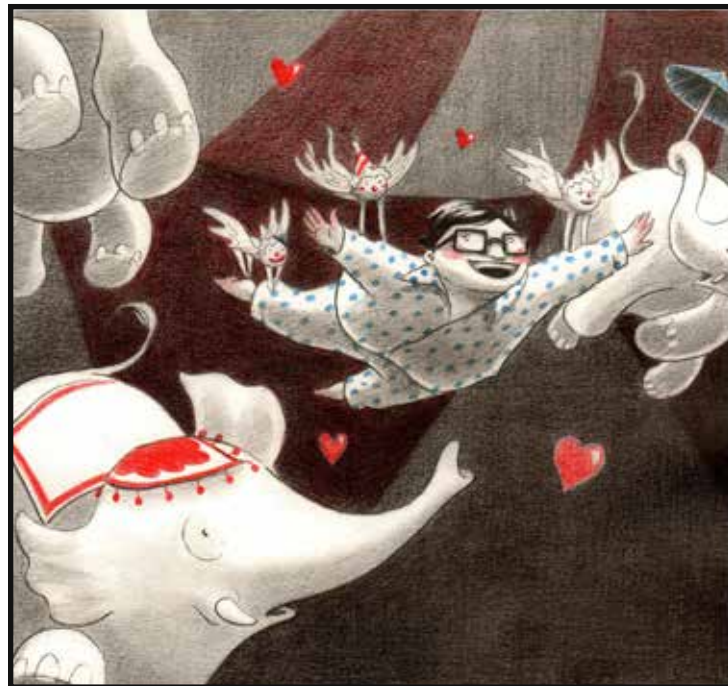
© Nina Jacqmin - Les enfants rouges