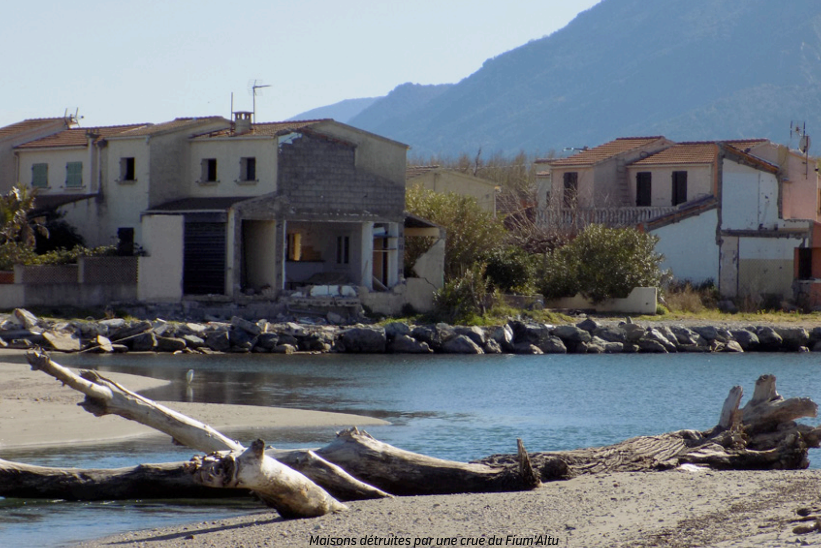
Maisons détruites par une crue du Fium'Altu

toutes les zones de notre compétence si on veut des actions cohérentes. » Ainsi, une étude sur la prise de compétence Gemapi permettra de faire un état des lieux et de déterminer le plan d'action pluriannuel à engager à partir de 2019. De plus, en collaboration avec l'université de Corse, une étudiante de Master 2 «Risques majeurs» est actuellement en contrat d'alternance au sein de la communauté de communes. Son rôle est d'établir les plans communaux de sauvegarde à partir desquels pourra être rédigé le plan intercommunal où seront consignés, pour ce qui concerne la Gemapi, tous les thèmes en lien avec la prévention du risque inondation mais également les modalités à mettre en œuvre en cas de crise. «Et nous essaierons de garder un peu d'argent en cas de travaux d'urgence...»