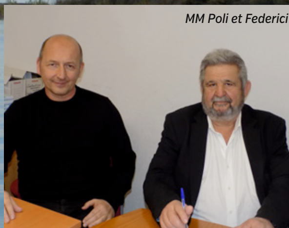
MM Poli et Federici