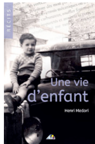
Une vie d'enfant éd. AEDIS, 176 p.