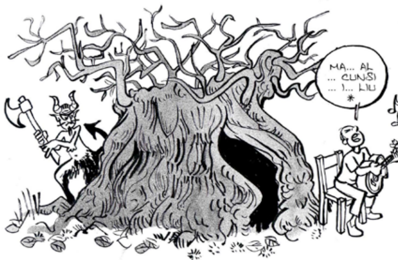
* Réunion du mal (chanson de J.P. Poletti)