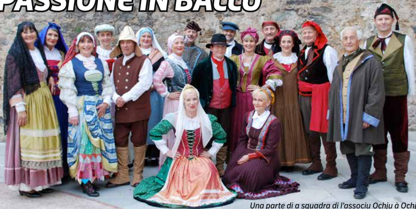
Una parte di a squadra di l'associu Ochju à Ochju