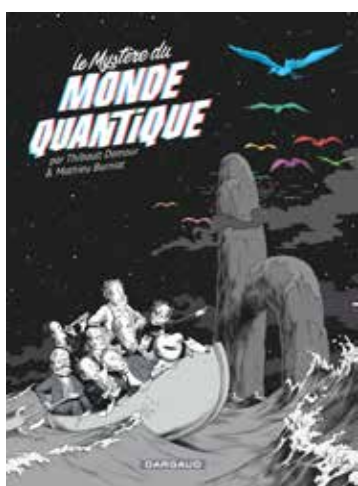
Thibault Damour-Mathieu Burniat, Le mystère du monde quantique Dargaud, 2016

Car, ce qu'a voulu montrer cette BD c'est bien un ensemble de questions non toujours entièrement résolues, mais notre vision classique ébranlée par ces multiples découvertes qui, depuis Einstein, ouvrent vers un vertigineux ensemble de possibilités y compris les plus mystérieuses pour nos esprits actuels. ■