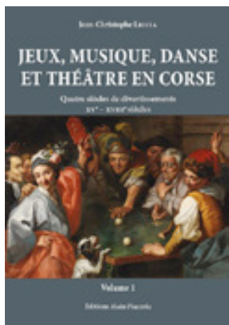
Jean-Christophe Liccia Jeux, musique, danse et théâtre en Corse Quatre siècles de divertissements XV e -XVIII e siècles 2 volumes Éditions Alain Piazzola, 2019

LIVRES, MUSIQUE, ARTS & SPECTACLES, CINÉMA