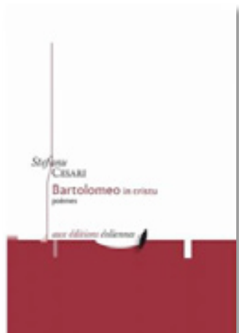
Stefanu Cesari Bartolomeo in cristu