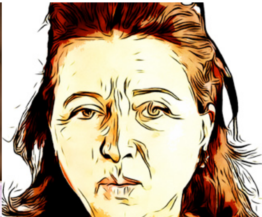
Illustrations d'après photos DR