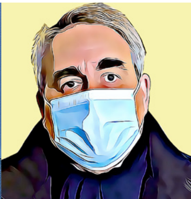
Illustrations d'après photos DR

ces noms ne disent pas grand-chose aux communs des électeurs, qui ont autre chose à faire qu'éplucher un plan de Paris. Signalons, pour les prochaines réunions, que le ministère de l'Éducation siège rue de Bellechasse, celui de l'Économie à Bercy, la Justice place Vendôme, la Défense rue Saint Dominique, l'Intérieur place Beauvau, les Sports avenue de France, la culture rue de Valois, l'agriculture rue de Varenne et l'Élysée rue du Faubourg St Honoré. Mais on ne peut pas faire «un Saint-Honoré»: c'est déjà pris par les pâtisseries.