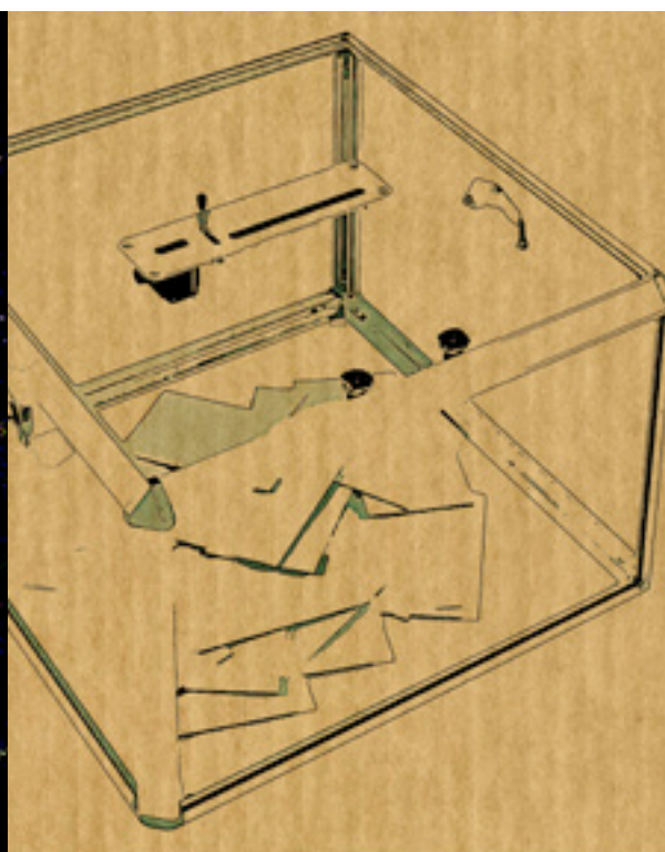
Illustrations d'après photos DR

mais elle a [heureusement!] été retoquée in fine. L'ensemble a un petit air de route vers la décroissance, mais laissons les spécialistes en juger.