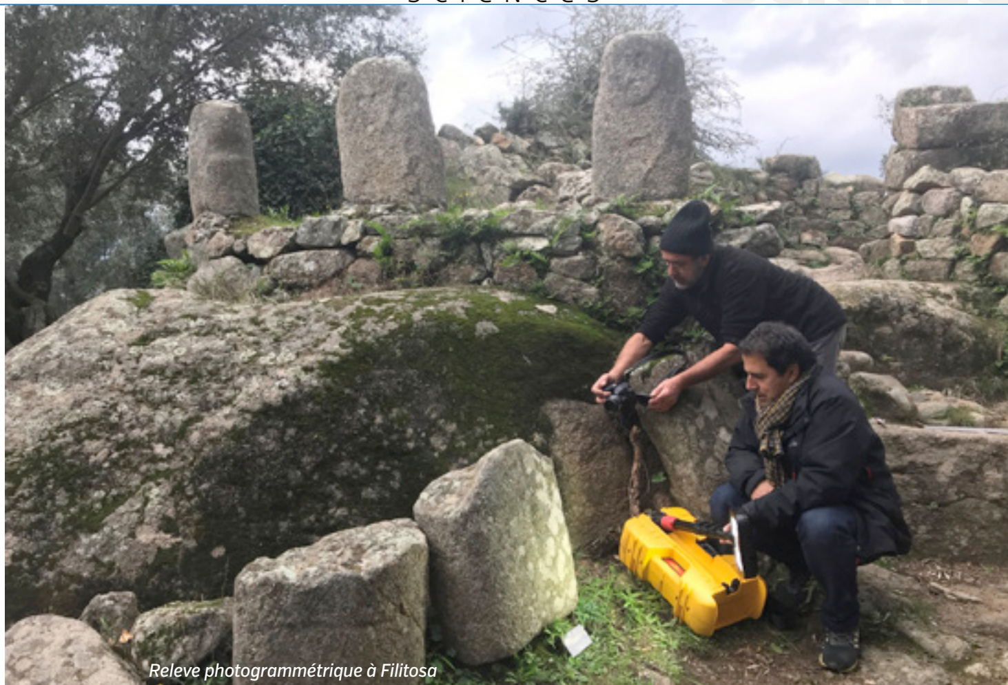
Relevé photogrammétrique à Filitosa

que ça facilite, mais que ça permet d'approfondir grandement ce que l'on va tirer des connaissances de chaque vestige. Sur un squelette, par exemple, avant on allait étudier la morphométrie, mesurer des ossements, maintenant on va faire des analyses ADN, des analyses de paléo nutrition sur des prélèvements de dents. Des analyses au carbone 14, c'est un peu plus classique, mais on va approfondir tout ce qu'on va pouvoir tirer comme informations de chaque vestige. Par rapport aux sédiments et à la terre qu'on va pouvoir extraire des sites, on peut faire aussi des analyses sur les pollens pour reconstituer l'environnement paysager qu'il y avait autour d'un site. Parce que sur le site, le paysage n'était pas forcément tel qu'on voit aujourd'hui. Ces dernières années, on a découvert que certains sites étaient implantés à côté d'un bras de mer qui a aujourd'hui disparu et du coup nous avons une lecture et une vision complètement différente du site dans son environnement d'origine.