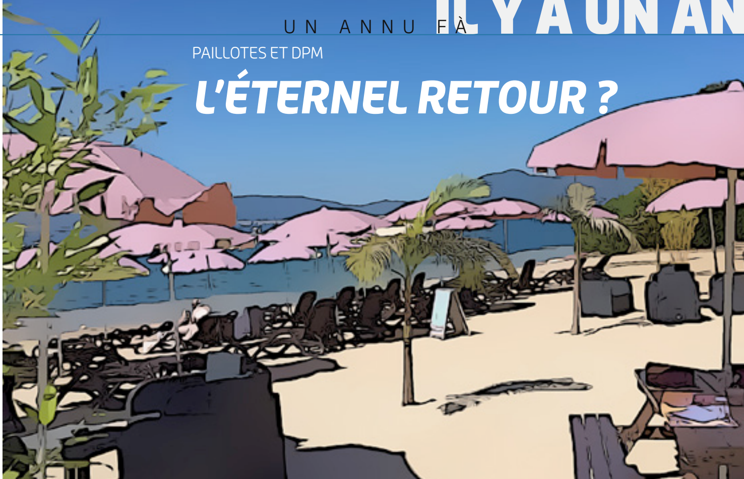
Illustration d'après photos DR