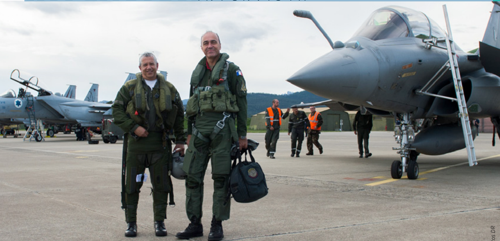
André Lanata, chef d'état major de l'Armée de l'air, sur la base de Solenzara avec son homologue de l'armée de l'air israélienne, en 2016.