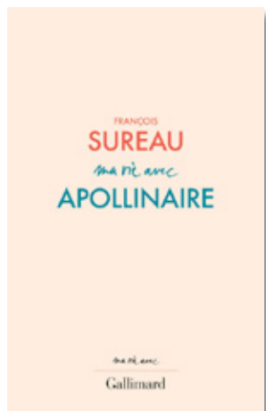
François Sureau Ma vie avec Apollinaire, Gallimard, 2020