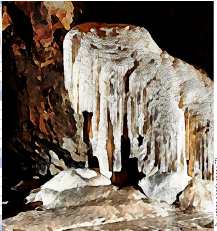
Illustrations d'après photos DR

ou non faire confiance aux Français, puisqu'on n'a pas essayé ? Sinon, pour la route, il y a aussi Balzac parlant des « méchancetés de la bureaucratie » dans Les employés . « La bureaucratie, écrit-il, mettait un obstacle à la prospérité du pays [...] s'épouvantait de tout, perpétuait les lenteurs [...] étouffait les hommes de talent assez hardis pour vouloir aller sans elle ou l'éclairer sur ses sottises. » C'était en 1837.