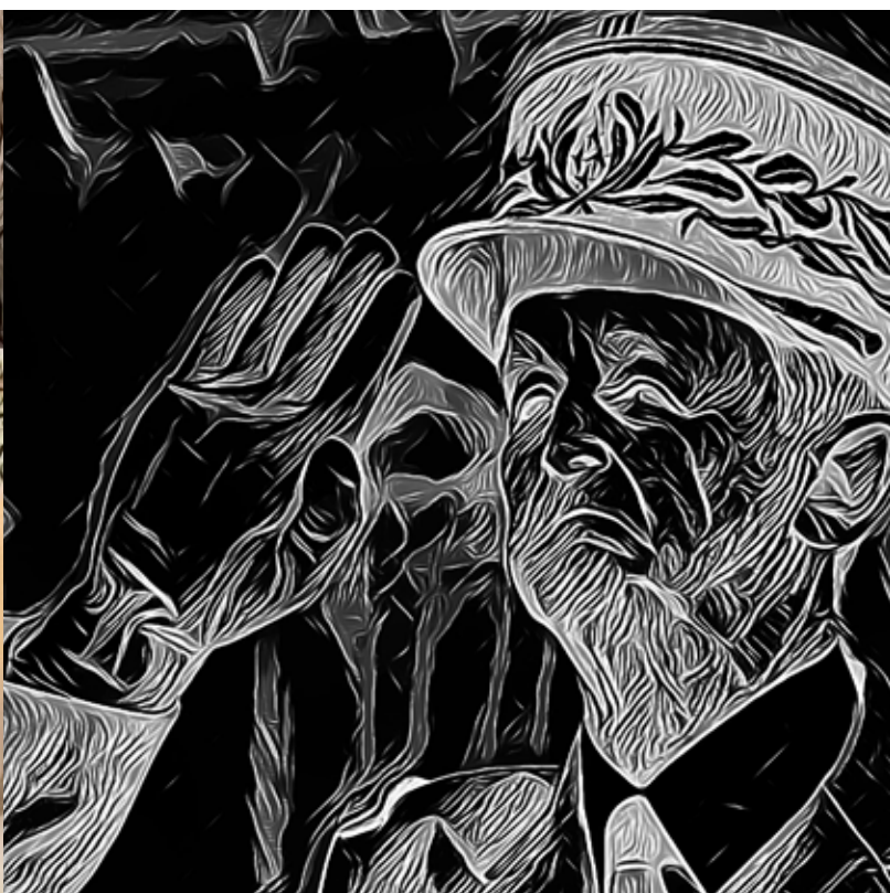
Illustrations d'après photos DR