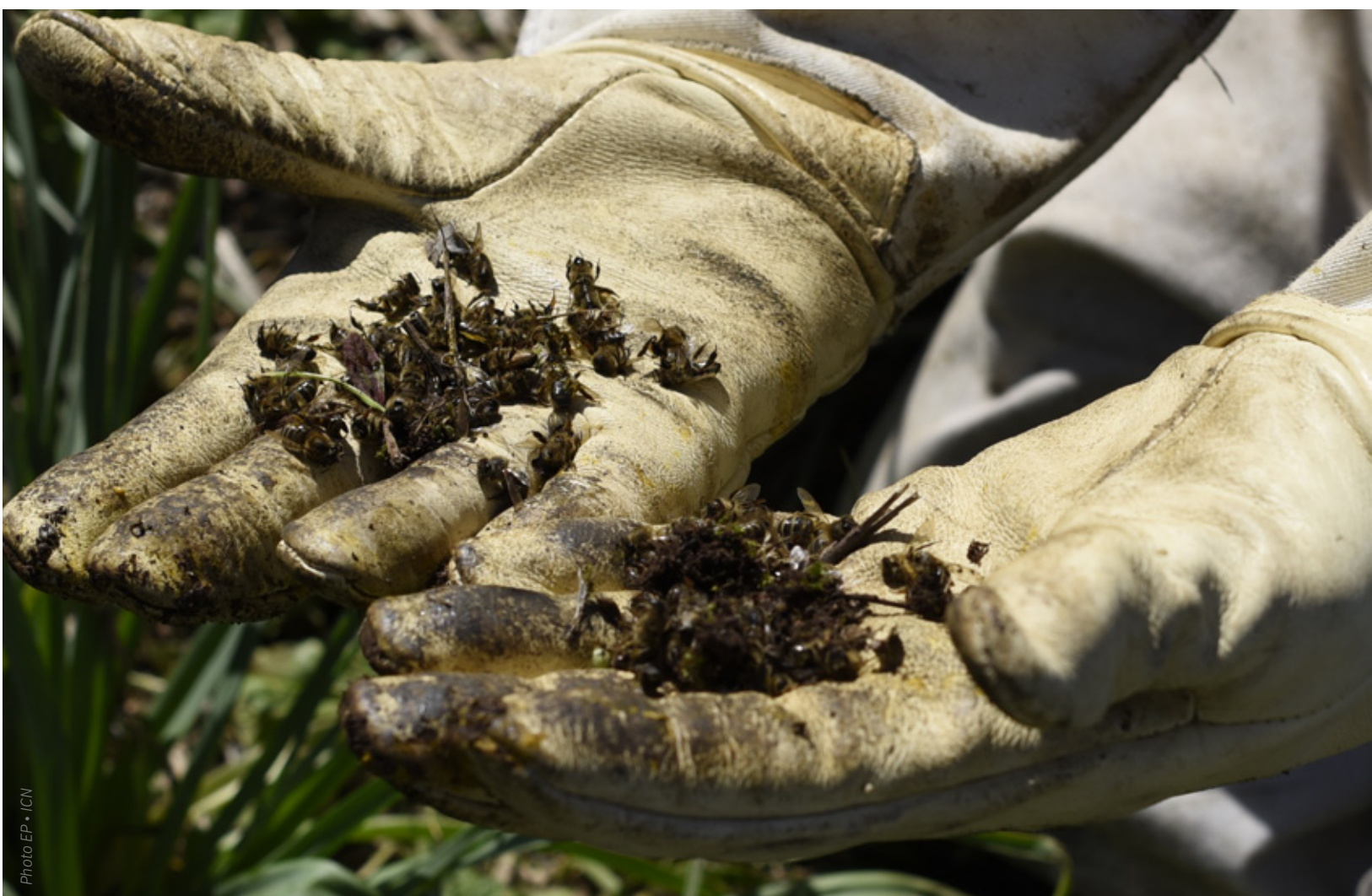
Abeilles mortes à l'entrée d'une ruche

«Qu'on soit aussi nombreux à se déplacer pour se réunir, à cette époque de l'année, c'est déjà un signe qui ne trompe pas. En général, à cette période-là, on n'a même pas le temps de se parler au téléphone!»