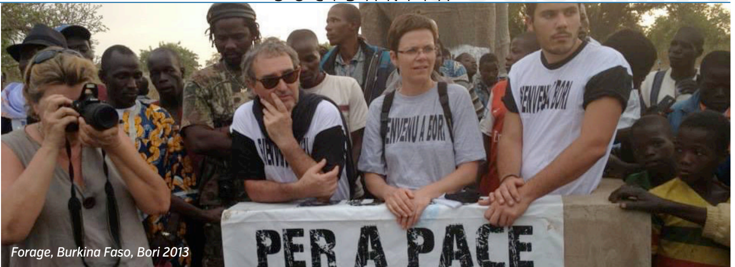
Forage, Burkina Faso, Bori 2013