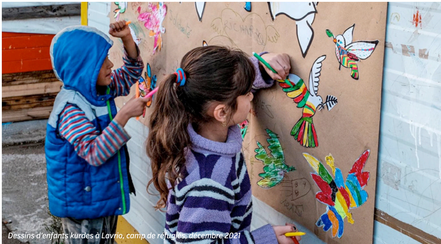
Dessins d'enfants kurdes à Lavrio, camp de réfugiés, décembre 2021