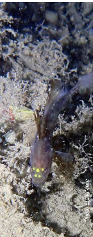
Juvenile et marquages élastomère